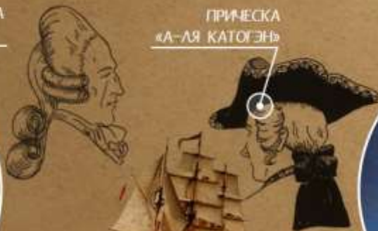
ПРИЧЕСКА «А-ЛЯ КАТОГЭН»