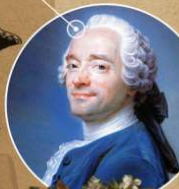
ПРИЧЕСКА «КРЫЛО ГОЛУБЯ»