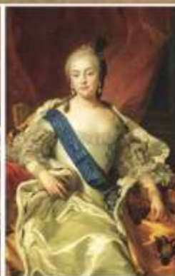
Шарль-Андре ван Лоо