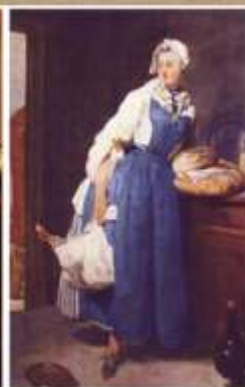
Жан-Батист Симеон Шарден