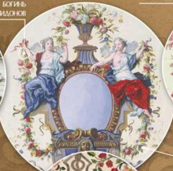
ТУАЛЬ ДЕ ЖУИ