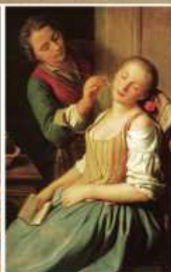
Пьетро Антонио Ротари