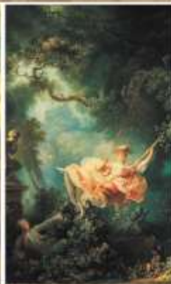
Жан Оноре Фрагонар